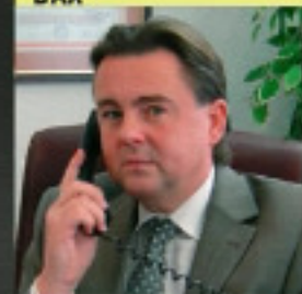
MOJMIR HLINKA AGFIF INTERNATIONAL