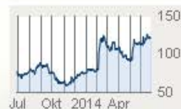
Keurig Green Mountain